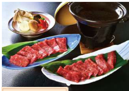
甲州牛とワインビーフ

KKR甲府ニュー芙蓉料理長 出身地 和歌山県 ■経歴等 KKR奈良みかさ荘料理長 KKR箱根青風荘料理長