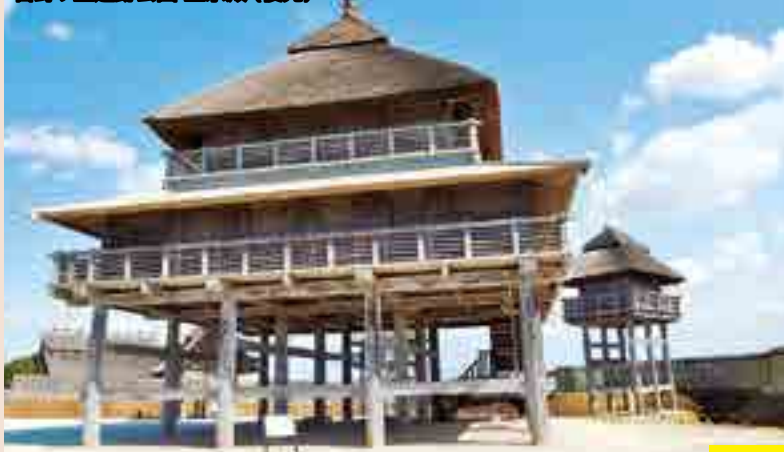
吉野ヶ里遺跡公園 主祭殿(復元)