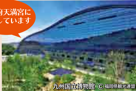
九州国立博物館