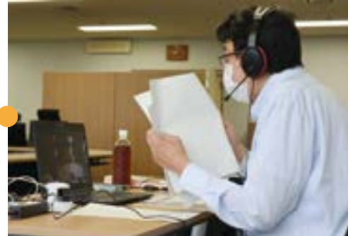
東京の連合会会議室