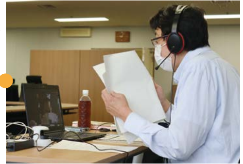
東京の連合会会議室