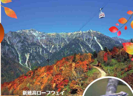
新穂高ロープウェイ