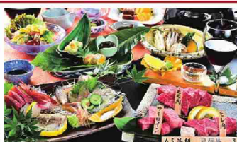
A5等級 飛騨牛 3種

食事 朝食はお部屋で「おにぎり弁当」 スラン共通 特典 星座早見表プレゼント 条件 11/10～12/28の木～月曜日(火・水曜日を除く) ／1室1名様利用はプラス2,000円(平日のみ利用可) ※毎週火・水曜日は素泊まりプランのみ受付(お1人様5,000円～)