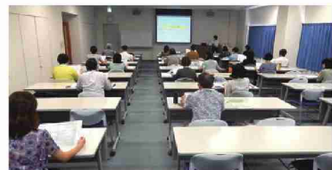
開催した「KKRマネープランセミナー50」の様子