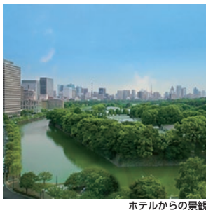
ホテルからの景観

条件 5/10~6/30/1室2名様の場合1名様プラス1,600円で皇居側デラックスツインへ変更可