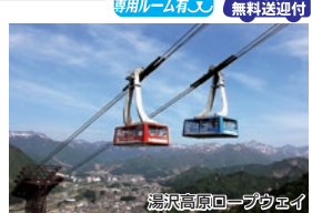
湯沢高原ロープウェイ

条件 5/10~6/30/1室1名様利用はプラス1,000円(平日のみ利用可)/3日前までに要予約