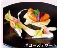
洋コースデザート