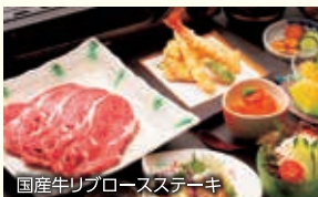
国産牛リブロースステーキ