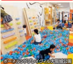
ボーンランドプレイヴィル大阪城公園