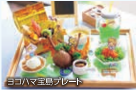
ヨコハマ宝島プレート