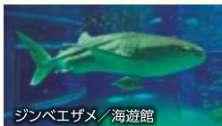
ジンベエザメ / 海遊館

特典 海遊館入館券付(通常大人2,400円) ※ご希望の入館日時をお教えてください