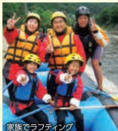
家族でラフティング

【特典】お泊りの翌日はラフティング半日 体験付(通常大人6,500円~7,000円)