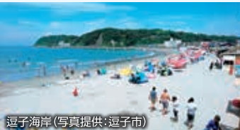
逗子海岸

特典 ●お食事付のお子様には花火プレゼント(小学生以下) ●到着日13時からチェックアウト後14時まで休憩室・駐車場・温水シャワー無料(要予約)