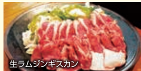
生ラムジンギスカン

【条件】7/1~9/30/1室1名様利 用はプラス1,000円/Tなし客室は1 名様1,000円引