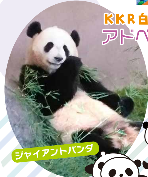
ジャイアントパンダ