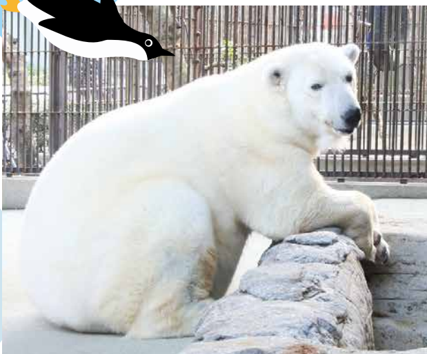
ホッキョクグマのピース