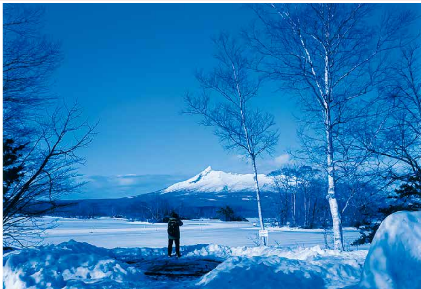
「冠雪した駒ヶ岳」北海道七飯町大沼